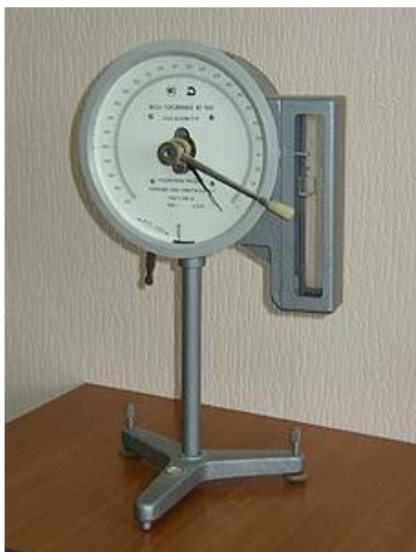
Рис 1. Торзионные весы