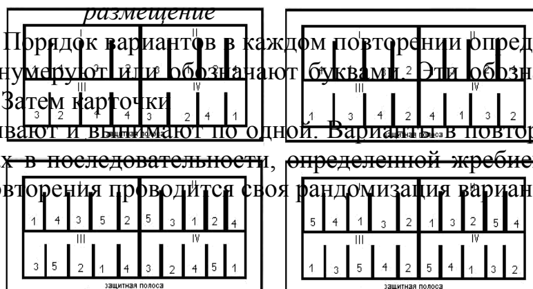
Рис. 2. Многоярусное размещение делянок

а вариантов. Порядок вариантов в каждом повторении определяется жребием. Варианты нумеруют или обозначают буквами. 2 Эти обозначения пишут на карточках. Затем карточки перетасовывают и вынимают по одной. Варианты в повторении размещают на делянках в последовательности, определенной жребием (случаем). Для каждого повторения проводится своя рандомизация вариантов.