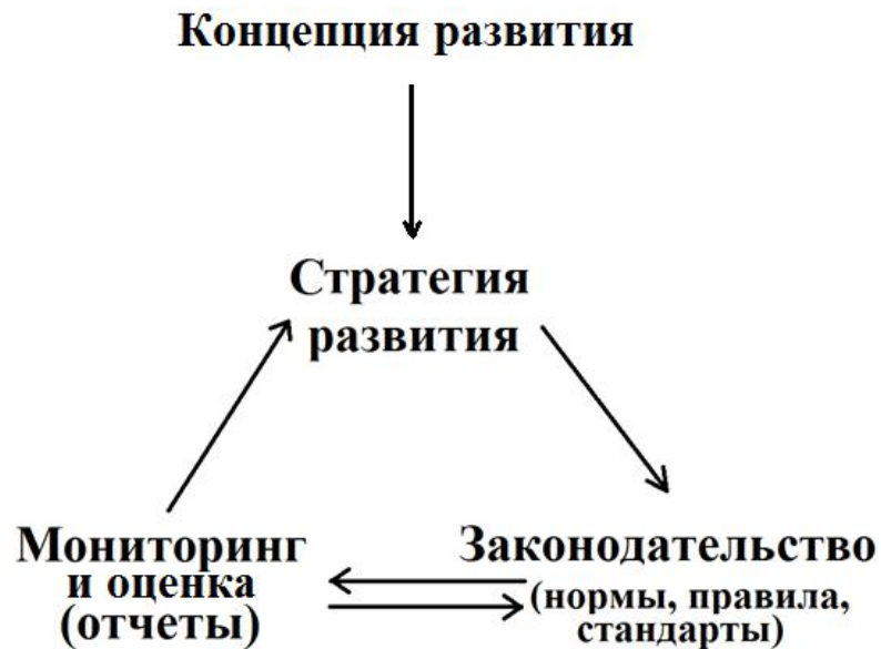
Рис.3 Структура механизма институционализации концепции устойчивого развития

Соответственно структура механизма институционализации устойчивого развития может быть представлен следующим образом (рис.3):