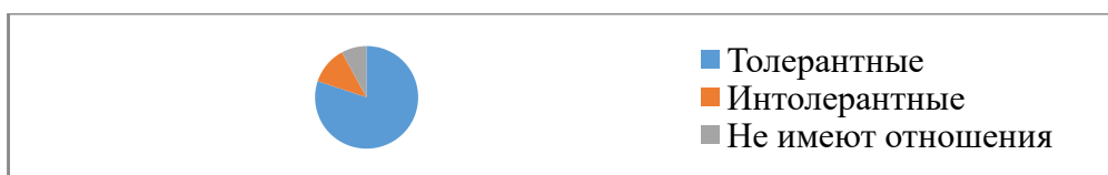
Рисунок 6 — Комментарии к новостям о наказаниях после боя Хабиба Нурмагомедова и КонораМакГрегора на странице «Bestof MMA».

Мы рассмотрели 104 комментария, посвященных отстранению МакГрегора и Нурмагомедова на англоязычной странице «MMA News». 24 рассмотренных комментария не относятся к категориям толерантности и интолерантности. 27 рассмотренных комментариев можно назвать толерантными, а 53 комментария оказались интолерантными.