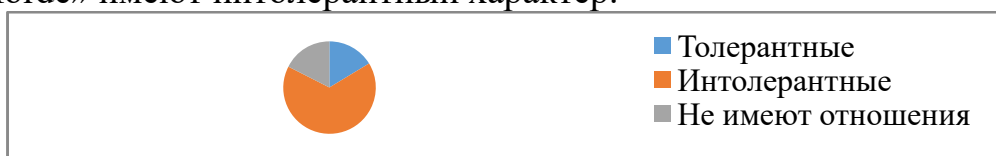
Рисунок 8— Комментарии к новостям о наказаниях после боя Хабиба Нурмагомедова и КонораМакГрегора на странице «PoMorde».

Количественный анализ 54 комментариев к новостям об отстранении бойцов на странице «PoMorde» выявил 14 комментариев, которые нельзя отнести к толерантной или интолерантной коммуникации. 13 рассмотренных комментариев можно определить толерантными, а 27 комментариев, посвященных отстранению МакГрегора и Нурмагомедова, на странице «PoMorde» имеют интолерантный характер.