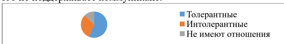
Рисунок 1— Комментарии к пресс-конференции с участием КонораМакГрегора и Хабиба Нурмагомедова на странице «Bestof MMA».

Рассмотрев комментарии к публикациям по данным темам на странице «Bestof MMA» мы определили, что из 387 комментариев о пресс-конференции с участием КонораМакГрегора и Хабиба Нурмагомедова, 215 комментариев можно назвать толерантными, 120 комментариев — интолерантными, а 48 комментариев нельзя отнести к толерантной или интолерантной коммуникации —они не имеют отношения к восприятию пользователями прочитанного сообщения, не выражают позитивных и негативных эмоций. Это, например, вопросы, ссылки на другие сообщения и сайты, вставленная в комментарии музыка. Самым популярным выражением интолерантности в данных комментариях является использование уничижительных, грубых слов по отношению к бойцам и фанатам бойца, которого не поддерживает коммуникант.