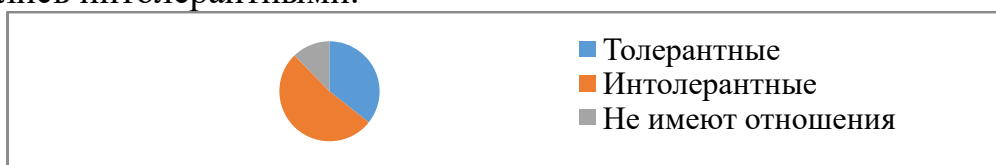
Рисунок 4— Комментарии к записи боя КонораМакГрегора и Хабиба Нурмагомедова на странице «MMA News».

Мы рассмотрели 73 комментария к бою Нурмагомедова и МакГрегора на англоязычной странице «MMA News». 9 комментариев нельзя отнести к толерантной и интолерантной коммуникации, к примеру, это уточнение названия приема, после которого был завершён бой. 26 рассмотренных комментариев мы относим к толерантным. 38 комментариев, посвящённых бою МакГрегора и Нурмагомедова, на англоязычной странице «MMA News» оказались интолерантными.