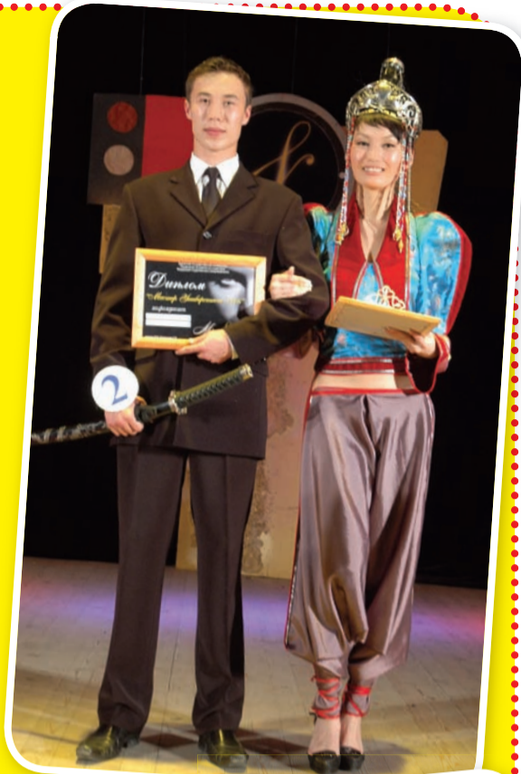
"За кадром" конкурса!

Ну что ж, призы вручены, акцентеры расставлены, но проигравших и разочарованных в этот вечер сцена БГУ так и не увидела, ведь все ребята за время подготовки очень сблизились и были искренне рады победе своих новых друзей.