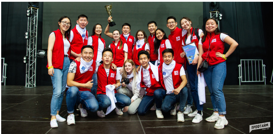
ФССУ БГУ с Кубком Гран-при Республиканской студвесны

как и в прошлом году, завоевали студенты БГУ им. Д. Банзарова, которые блестяще представили alma mater и заслужили самые восторженные отзывы