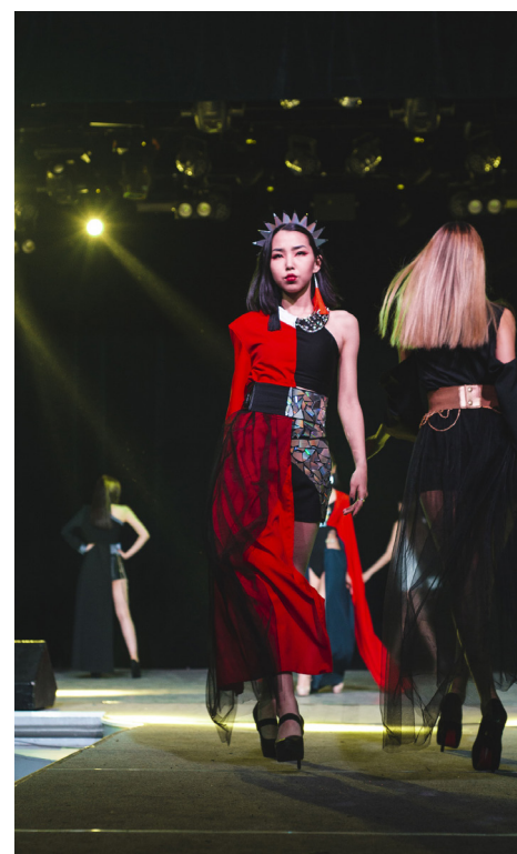
Дефиле Восточного института