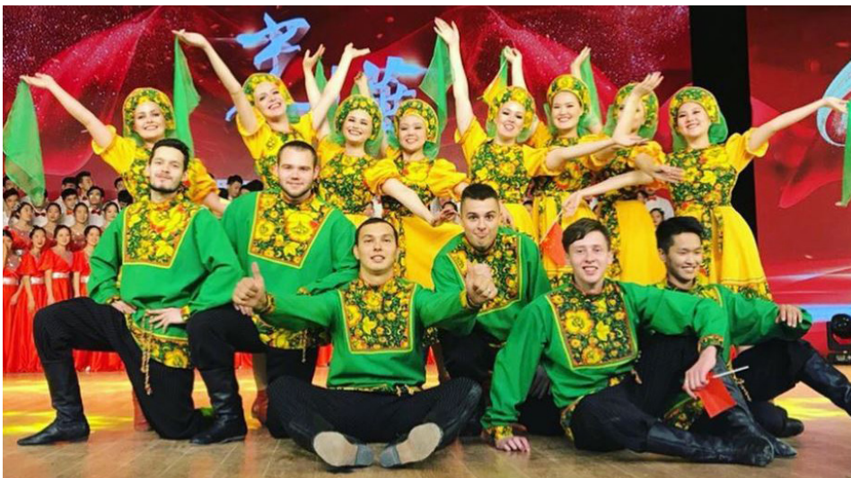
«Байкальские самоцветы» на юбилее в Чанчуньском политехническом университете

Стоит отметить, что за время своего существования ансамбль с успехом выступал во многих городах Российской Федерации, в таких как Москва, Санкт-Петербург, Владивосток, Чита, Иркутск и др., а также в зарубежных странах: Китай, Монголия. За это время студенческий ансамбль песни и танца «Байкальские самоцветы» стал многократным победителем и лауреатом российских и республиканских конкурсов и фестивалей, а также участником многих общественно значимых мероприятий в жизни Российской Федерации, Республики Бурятия, г. Улан-Удэ и Бурятского государственного университета имени Банзарова. Ансамбль принимал активное участие на фестивалях российских и китайских студентов в городах Китайской народной республики: Чанчунь и Манчжурия в 2010 году; торжественных мероприятиях посвященных 350-летию вхождения Республики Бурятия в состав Российской Федерации в 2011 году; торжественных мероприятиях посвященных 90-летию образования Республики Бурятия в 2013 году; на международном фестивале «Студенческая весна стран Шанхайской организации сотрудничества» в 2014 году; на VIII-м китайско-российском фестивале искусств Цицикарского университета в г. Цици-