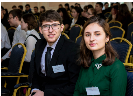
Члены команды БГУ по русскому языку и культуре речи

Олимпиада проходила по 14 предметным направлениям. В личном первенстве студенты БГУ заняли 1 место по 8 предметам: правоведению, философии, бурятскому языку, английскому языку, истории Отечества, физике, математике, информатике и программированию, а в командном первенстве по 9: русскому языку и культуре речи, правоведению, философии, бурятскому языку, английскому языку, физике, математике, информатике и программированию, экономике.