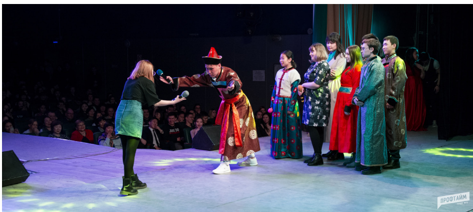
На концерте исторического факультета.

«Встречайте, концерт исторического факультета!»