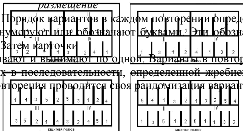
Рис. 2. Многоярусное размещение делянок

а вариантов. Порядок вариантов в каждом повторении определяется жребием. Варианты нумеруют и/или обозначают буквами. Эти обозначения пишут на карточках. Затем карточки перетасовывают и вынимают по одной. Варианты в повторении размещают на делянках в последовательности, определенной жребием (случаем). Для каждого повторения проводится своя рандомизация вариантов.