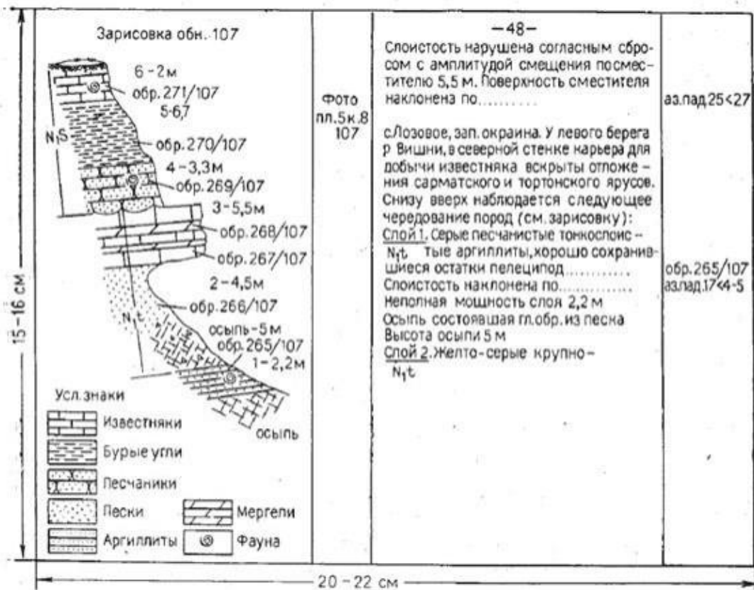
Рис. 1. Общий вид записей в полевом дневнике

На рис. 1 приведен образец записей в полевой книжке. На полях, очерчиваемых на левой странице книжки, ставится номер точки наблюдения. Справа в колонке для записей указывается подробный адрес точки, а затем следует описание. На правых полях этих страниц указываются: номера образцов, замеры элементов залегания жил, разрывов и т. д. Для того чтобы определять назначение замеров, их следует подчеркивать особыми знаками, например; замер элементов залегания - чертой сверху и снизу, замеры жил — волнистой чертой, замеры разрывов - пунктиром и т. д. Замеры трещин необходимо сразу же выписывать на одну из левых страниц, в специально разграфленную для этого таблицу. На левых полях следует делать пометки о сфотографированных объектах, пометать особо важные образцы с окаменелостями, рудными и иными минералами.