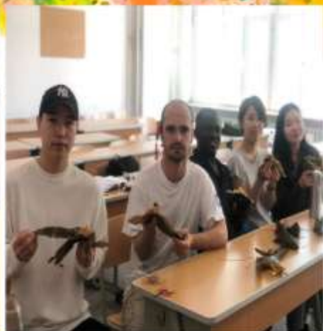
端午节（吃粽子） (๑ˊˋˊ๑)