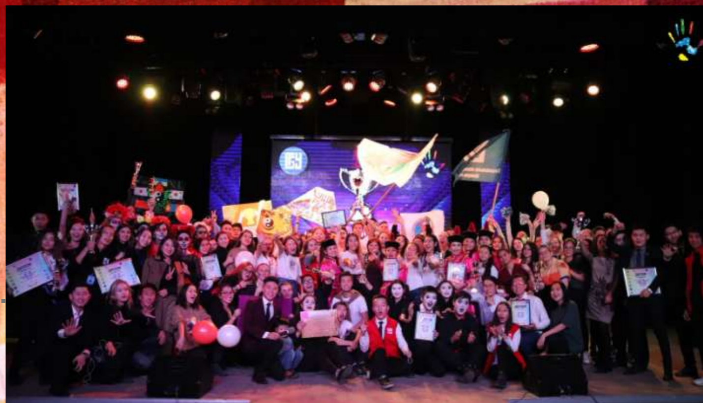
Мисс и Мистер Университет 2019