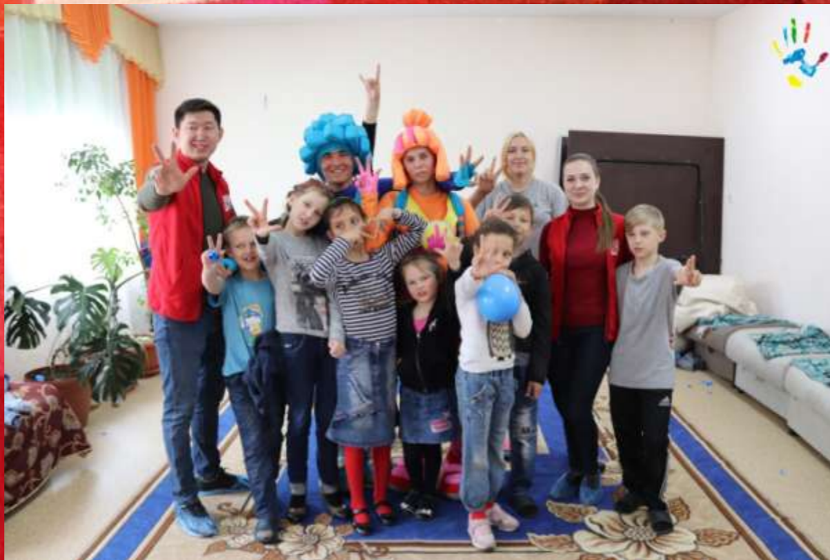
Социальная акция «Пазл Добра»