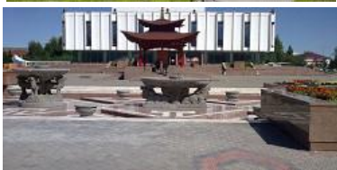
Буддийский молитвенный барабан, Кызыл, ул. Ленина, 35