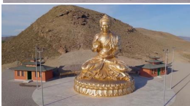
Статуя Будды слияния Большого и малого Енисея на горе Бельдир