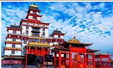
Буддийский храм, г. Кызыл, ул. Московская, д. 72