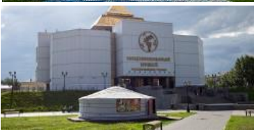
Национальный краеведческий музей Республики Тыва, Кызыл, ул. Титова, 30