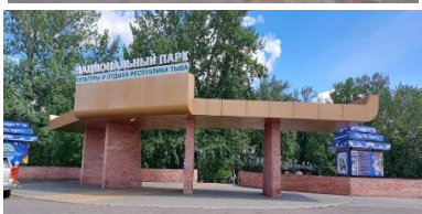
Национальный парк культуры и отдыха им. Н. Гастелло, г. Кызыл, ул. Кочетова, д. 1А